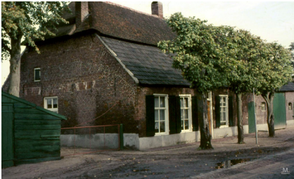
Dit was de boerderij waar nu de zwemschool is. Met de verbouwing is veel veranderd. Het is de oudst gedateerde boerderij van Leende. Hij is van 1682, gelegen aan de Oostrikkerstraat nr 26. Eertijds was het als café de eerste aanlegplaats voor de peelboeren. Reizigers tussen Eindhoven en Weert vertoefden hier, terwijl de paarden hun haver vonden in de voederbak, geplaatst onder de bomen voor het huis.