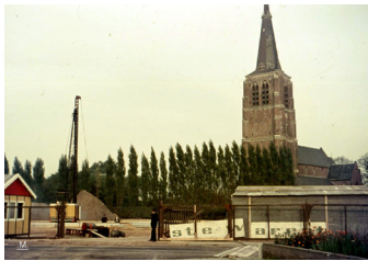
Indrukwekkende hijskranen doen het werk. De Bobo's kijken toe.