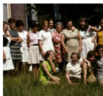
Het personeel van Sint Catharina.