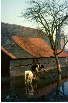
Achter de boerderij. Het blijkt een boerderij aan de Valkenswaardseweg te zijn.