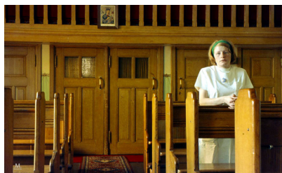
De kapel in Huize Sint Catharina.