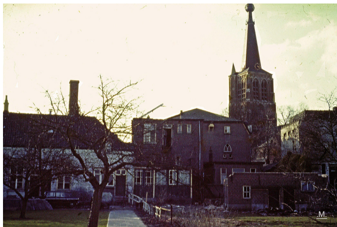
Het einde van Huize Sint Catharina.