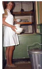
Binnen in het oude Sint Catharina. De kapel, de prachtige trap en de keukenlift. Deze bracht het eten en de vaat op de plaats van bestemming.