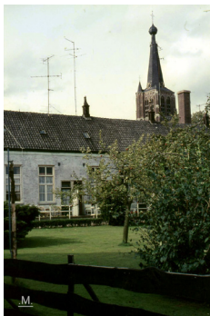
De achterkant van Huize Sint Catharina. In dit gebouw waren woningen voor ouderen.