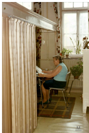
foto links een privé kamertje, rechts een mini sacristie.