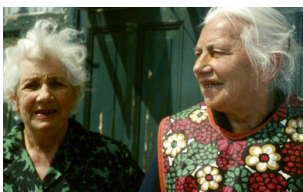
bewoners van Huize Sint Catharina.