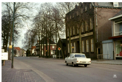
De Dorpsstraat met Huize Sint Catharina. Een Opel Record rijdt door de straat.